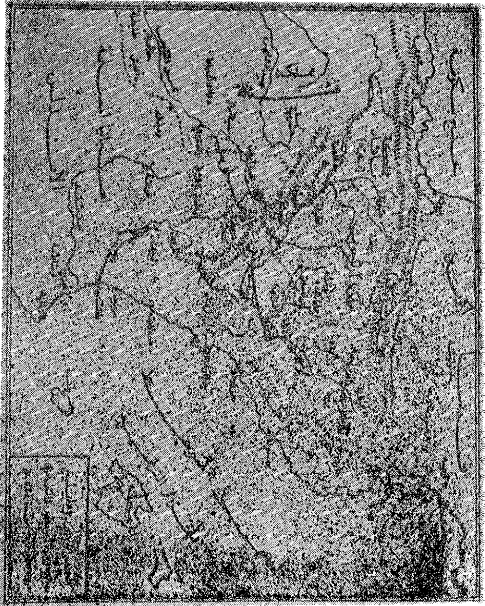
التغزى الاعلى وما يليه مواقع حروب الاربانيين والاسبان حتى موقعة سنة ٧٥٨هـ